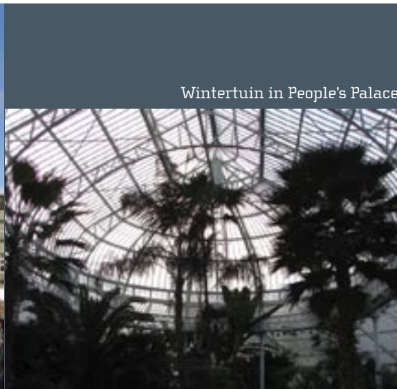
Wintertuin in People's Palace