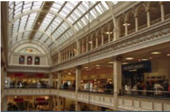
House of Fraser