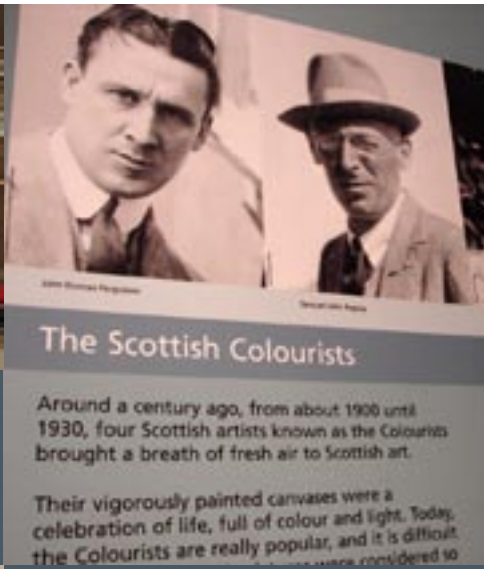
The Scottish Colourists