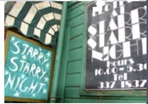
Vintage Starry Starry Night