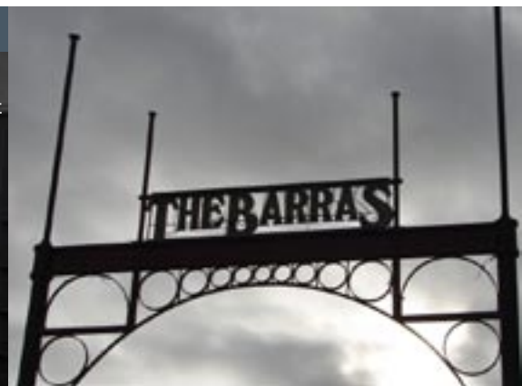
The Barras Market