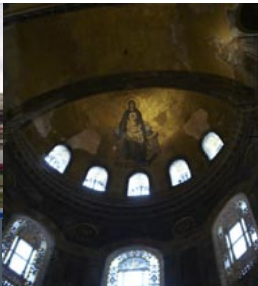
Hagia Sofia, Maria met Jezus