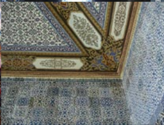
Topkapi Paleis, besnijdeniskamer (detail)