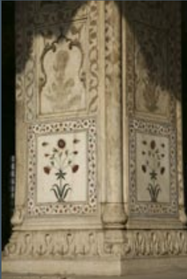
Rode Fort, pilaar met mozaïeken