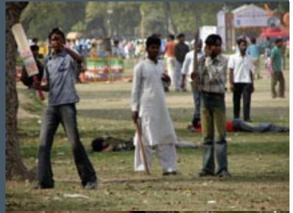
Cricket op zondagmiddag