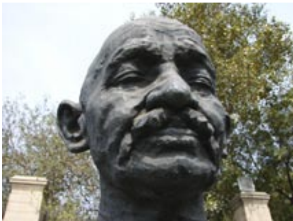
Mahatma Gandhi door Ram V. Sutar