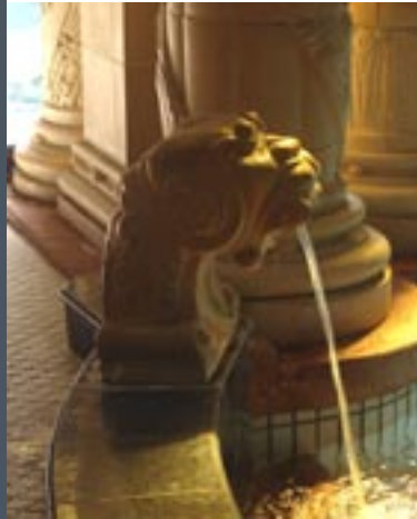
Zwembad Gellért Hotel

Lekkerste patisserie: bij Gerbeaud en in het gedeelte Buda, binnen de muren van het kasteel, daar bevindt zich het kleine maar zeer bijzondere Budavár Ruszwurm Cukrászda, gelegen in het straatje tegenover de Mátyás Kerk. 'The place to be' is restaurant Menza, op het Liszt Ferenc plein, retro jaren '70 interieur met prima kaart. In dit buurtje bevinden zich overigens vele restaurants. Keus genoeg.