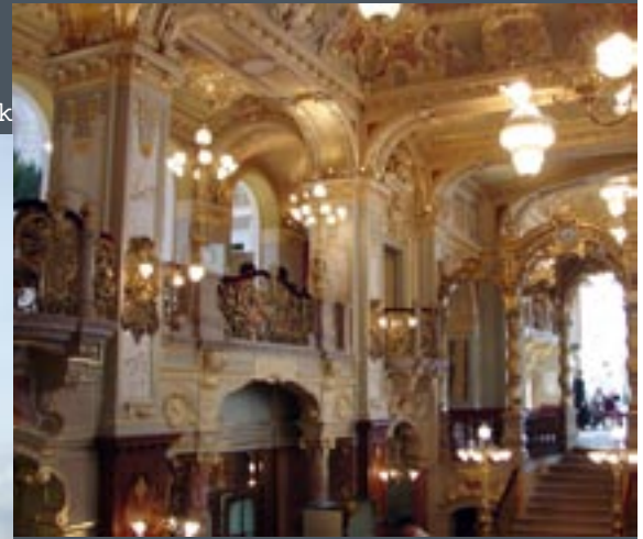
Hotel New York

nen hun lol niet op. In de kuurbaden binnen is het weldadig vertoeven. Zeker met een verkoudheid onder de leden. De meeste bezoekers dragen hier geen badkleding. Handdoeken in dit gedeelte worden uitgereikt, in alle andere baden van Boedapest is het raadzaam eigen handdoeken mee te nemen, huren is namelijk erg duur.