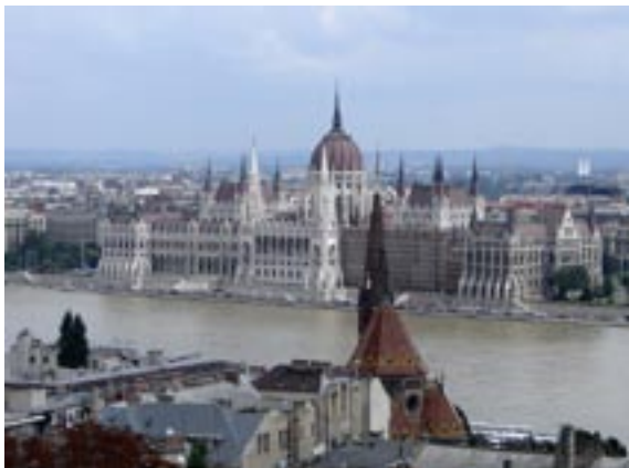
Zicht op de Donau met Parlementsgebouwen