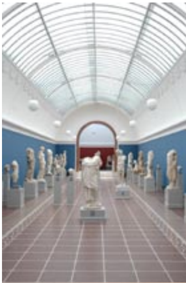
Ny Carlsberg Glyptotek