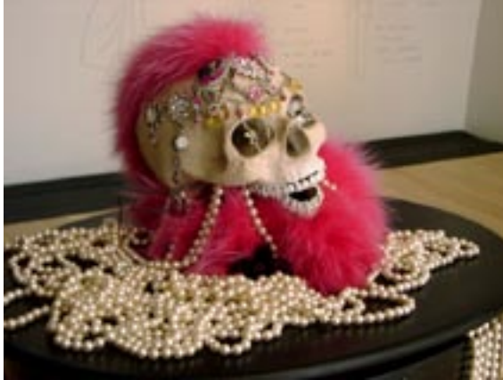
Bahsen en Baruel