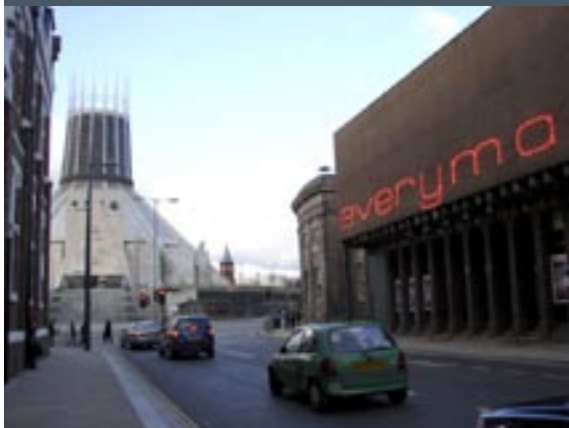
Katholieke kerk en Everyman Theatre