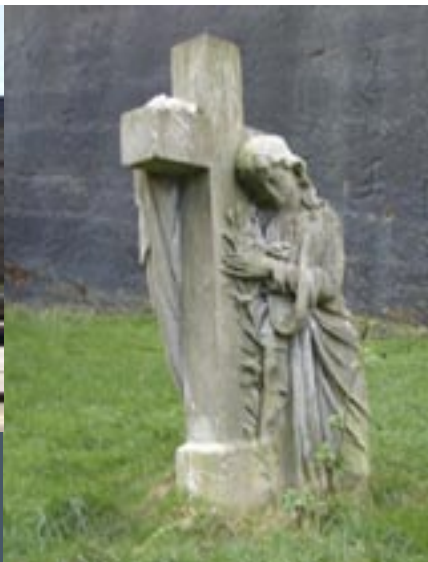
Detail St. James' Garden