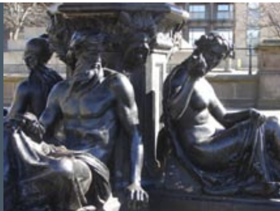
Fontein bij William Brown Street