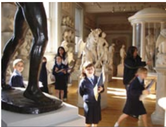
Walker Art Gallery