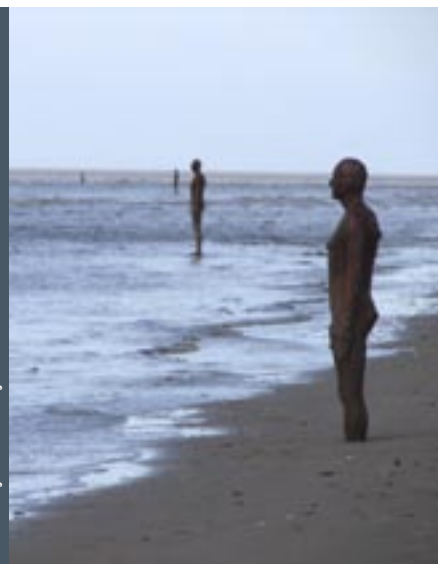
Anthony Gormley, 'Iron Man'