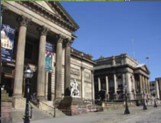
William Brown Street met Walker Art Gallery en County Sessions House