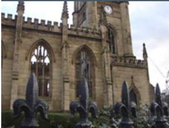
St. Luke's Church